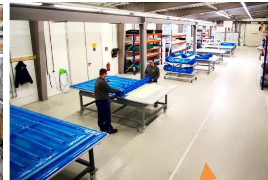
鉄道車両のフロアパネル